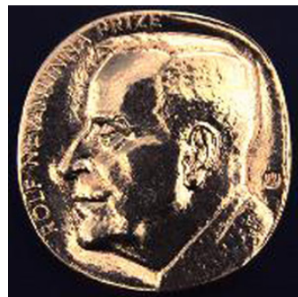
جایزه رولف نوانلینا