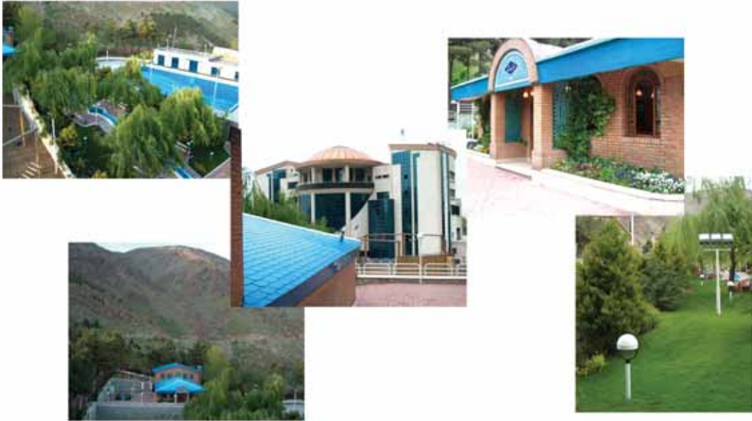
محل برگزاری کنفرانس: مرکز آموزش مدیریت پتروشیمی (شرکت راهبران پتروشیمی)