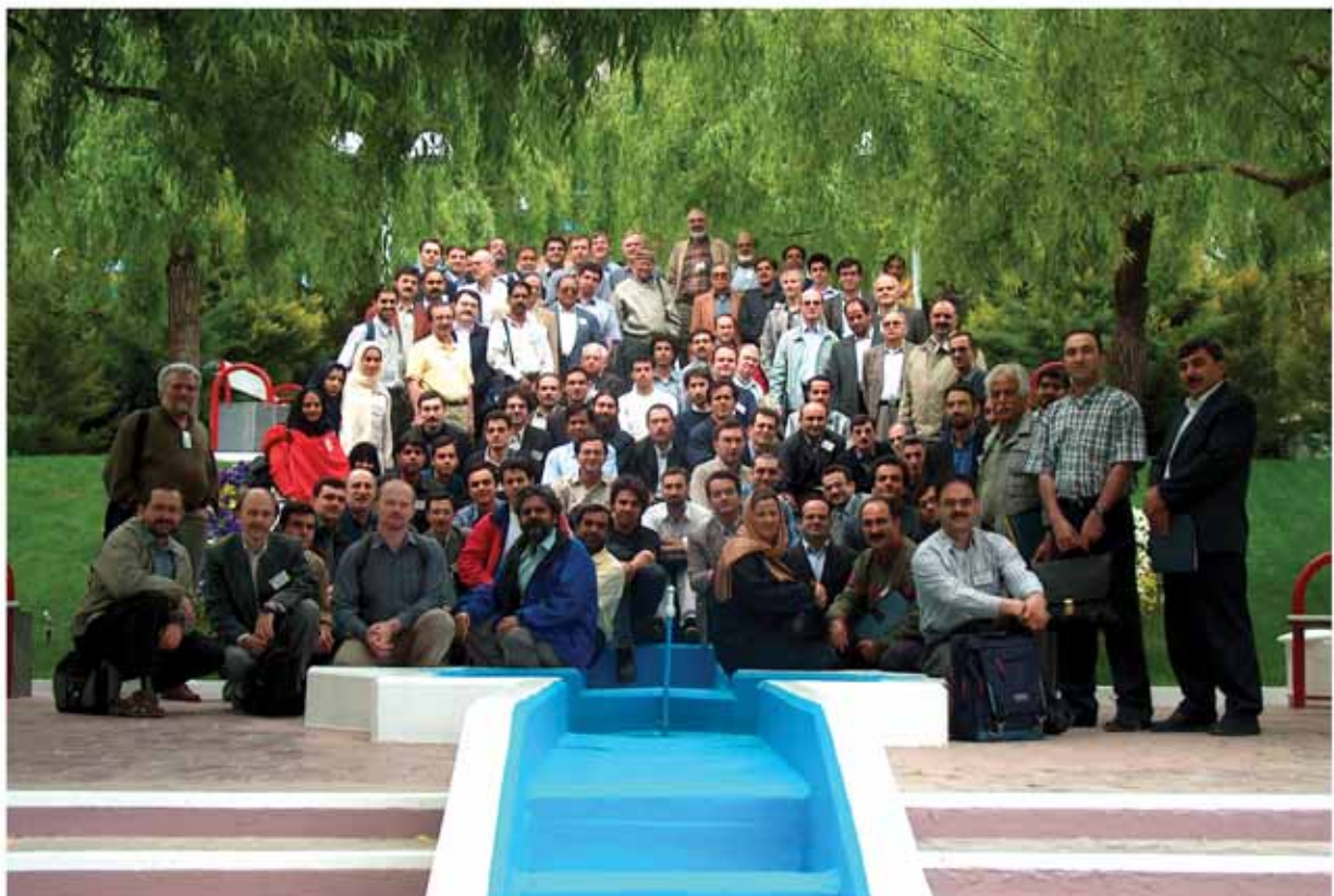
عکس دسته جمعی از یازدهمین کنفرانس منطقه ای ریاضی فیزیک